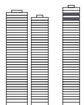
West Mitte Ost

Fläche 207.0 m 2 Balkon 51.0 m 2 Kellerabteil inklusive Parkplatz optional