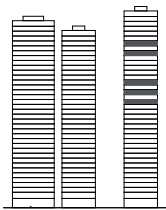
West Mitte Ost

Nummer E.2001, E.2201, E.2401 E.3001, E.3201 Typ 5A Tower Ost Geschoss 20. / 22. / 24. / 30. / 32. OG Fläche 166.0 m 2 Balkon 46.0 m 2 Kellerabteil inklusive Parkplatz optional